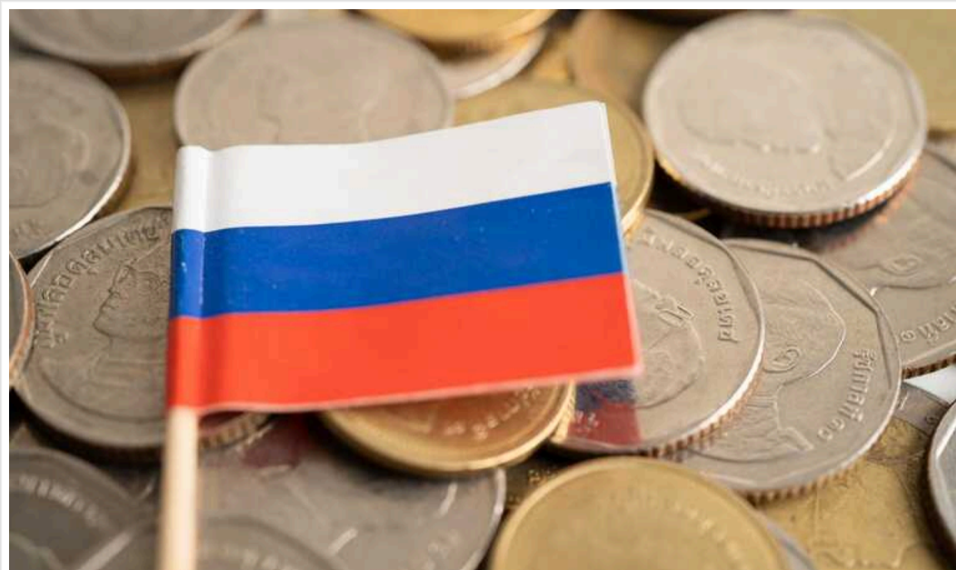
Financial Times: План з надання допомоги Україні за рахунок заморожених активів РФ «провалився»

Таким чином, ЄС готуються до надання Україні нових кредитів у розмірі 20-40 млрд євро до кінця року, незалежно від участі США.