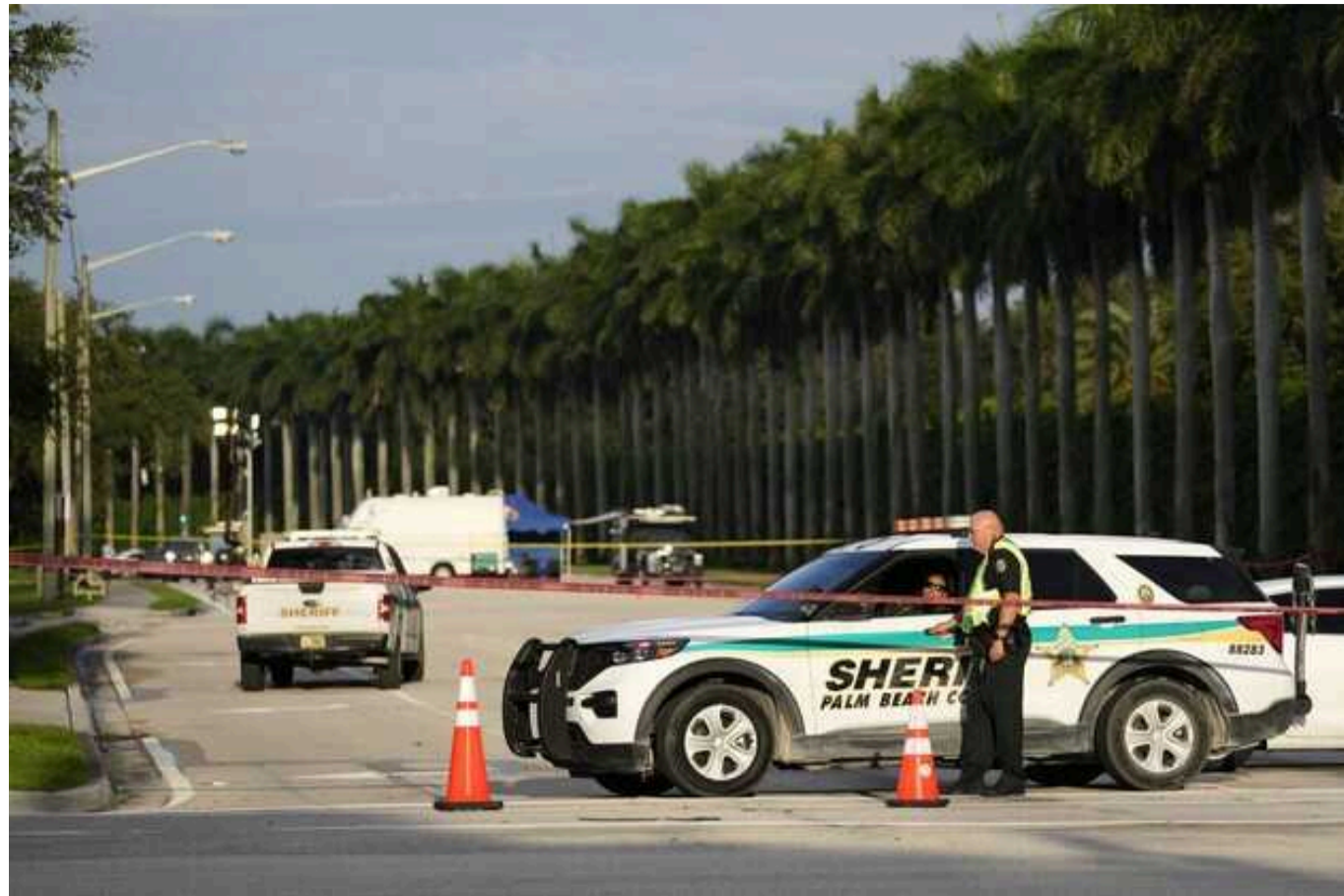
З'явилися подробиці другого замаху на Трампа у гольф-клубі Флориди

Чоловік, заарештований за підозрою в підготовці замаху на Дональда Трампа у Флориді, ймовірно, залишався непоміченим майже 12 годин, очікуючи колишнього президента США на полі для гольфу.