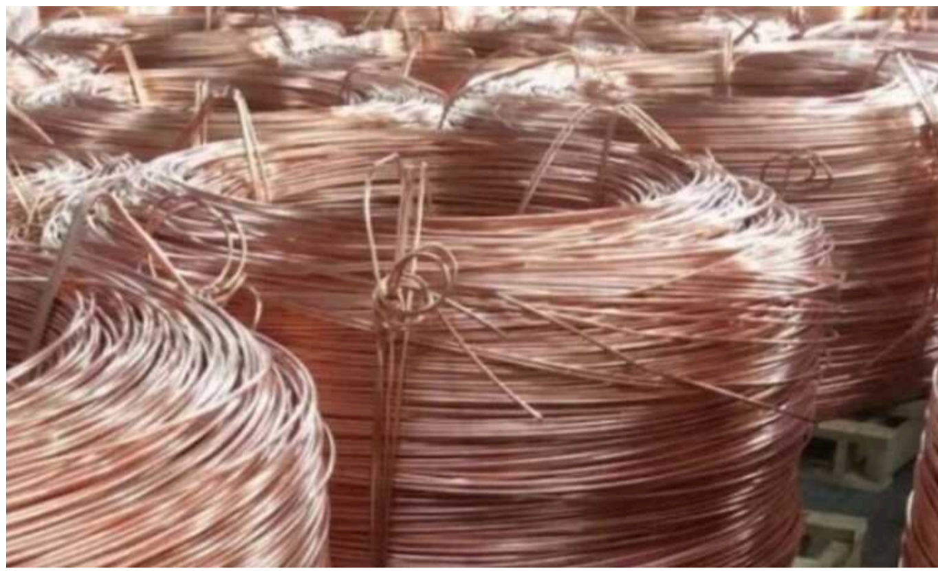
FT: Розвиток ШІ може залишити світ без міді