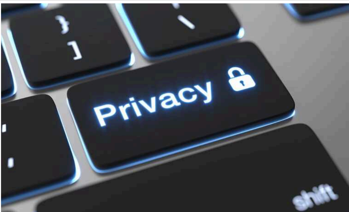
На вимогу поліції банки розкриватимуть банківську таємницю та особисті дані клієнтів

В Україні будуть змінені правила реагування банків на запити поліції стосовно можливих махінацій з коштами.