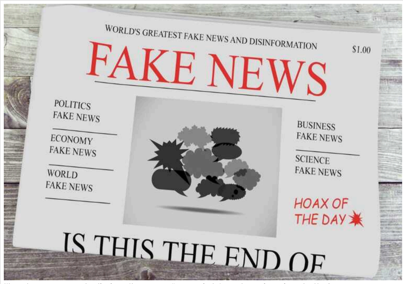
Журналісти виявили агенцію-підрядника Кремля, яка займається дезінформацією та дискредитацією України

Журналісти виявили, що російська "Агенція соціального дизайну", яка подає себе як організація, що займається медійним супроводом, насправді використовує дезінформацію для знищення іміджу України та просування інтересів Росії.