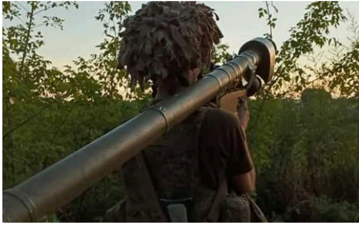
Військовий ЗСУ збив «шахед» за допомогою ПЗРК «Ігла» з тепловізійним приладом

Ворожий безпілотник був знищений воїном радіотехнічної бригади імені Богдана Хмельницького.