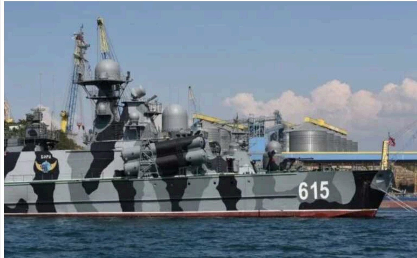
Невизнана Абхазія запропонувала Туреччині побудувати базу ВМС

На сайт лідера незвіданої республіки Аслана Бжаніі нібито була здійснена хакерська атака. Раніше Абхазія оголосила про намір укласти двосторонню угоду про дружбу і партнерство з Анкарою.