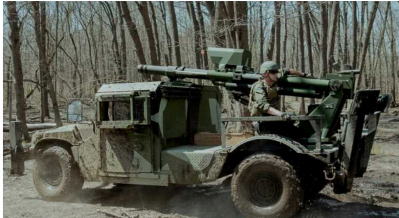
США тестують в Україні гаубиці Hawkeye на всюдиході HMMWV, – ЗМІ

За інформацією журналістів, наразі Hawkeye на HMMWV є експериментальним прототипом, який ще не було постачено навіть до американської армії. Рішення ухвалюватимуть на підставі результатів випробувань на фронті в Україні.