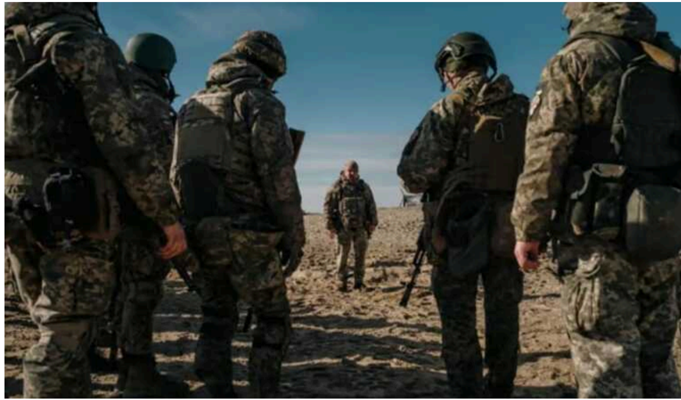
ISW: Недостатня західна допомога перешкоджає Україні у формуванні ефективних бойових підрозділів

Україна вжила заходів для подолання нестачі людських ресурсів у армії. Проте затримки та недостатня військова допомога з боку західних країн продовжують обмежувати її можливості у створенні ефективних бойових підрозділів.