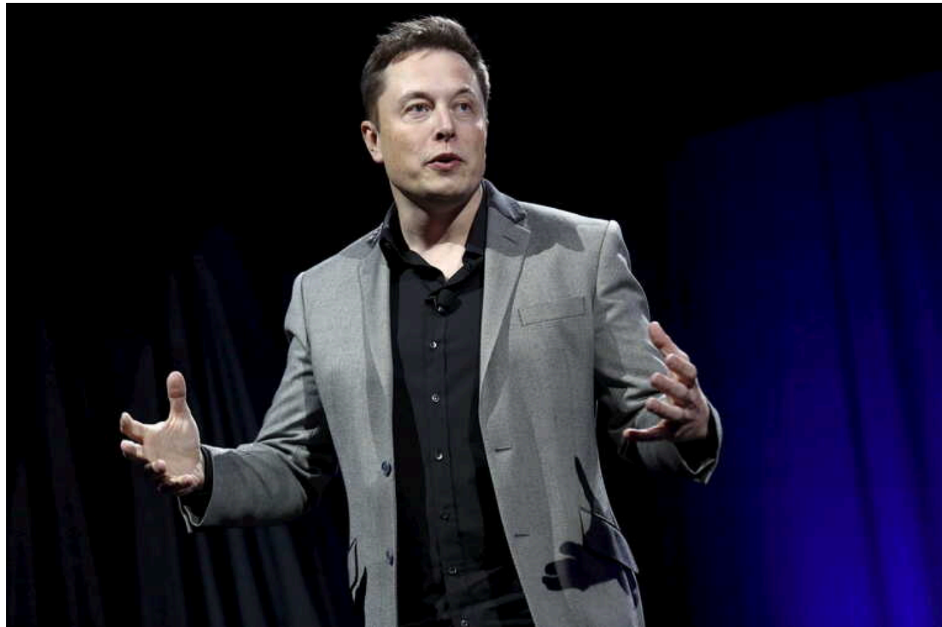
У Білому домі розкритикували коментар Ілона Маска про ймовірний замах на Трампа

У понеділок Білий дім розкритикував видалений пост мільярдера Ілона Маска. У ньому він порушив питання не лише про замах на кандидата в президенти США Дональда Трампа.