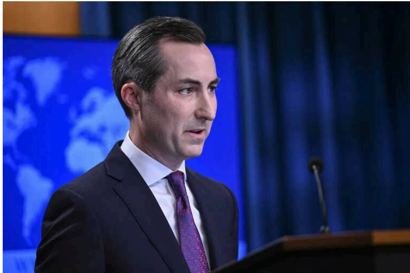
США не готові зняти обмеження на удари ВСУ далекобійною зброєю вглиб Росії, - Міллер

За підсумками переговорів між Байденом і прем'єром Британії, США не мають наміру заявляти про зняття обмежень на застосування далекобійної зброї ЗСУ для ударів вглиб Росії.