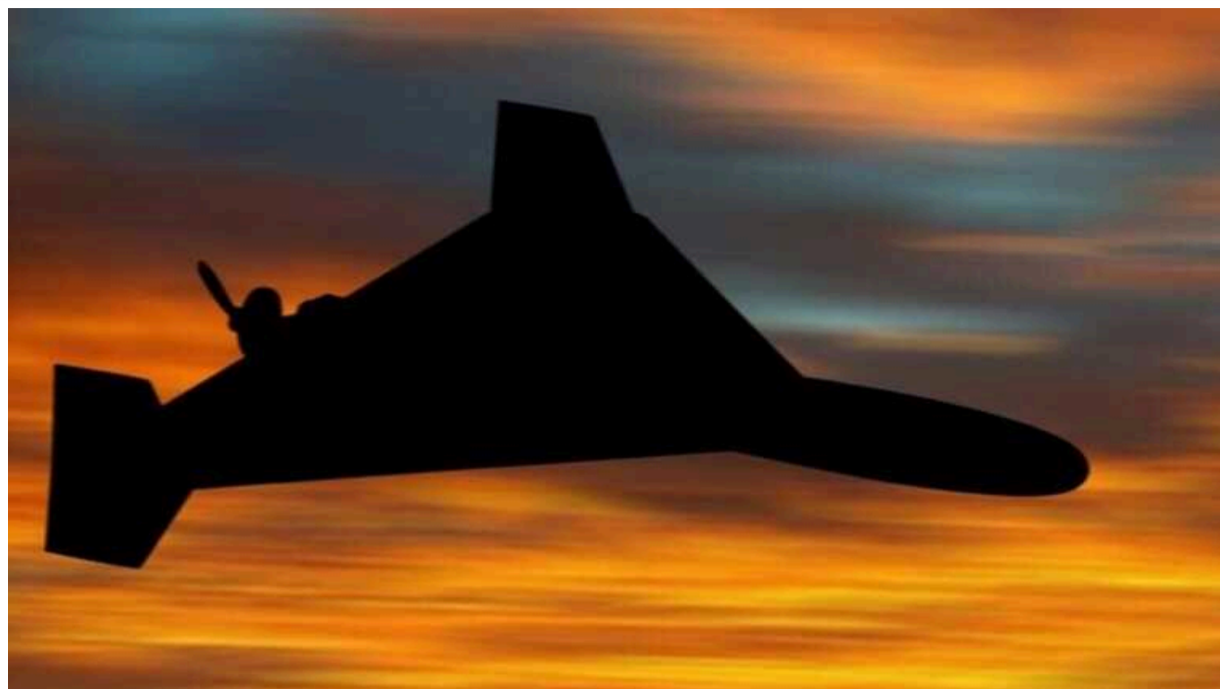
Окупанти завдали удару "Шахедами" по Конотопу

Російські окупанти вчора, 16 вересня, увечері атакували Конотоп. Вони вдарили по місту дронами-камікадзе типу "Шахед".