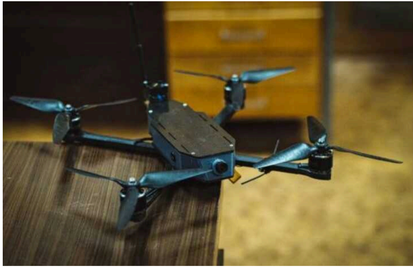
Росіяни вихваляються новим FPV-дроном, який може впізнавати цілі за допомогою ШІ

Таке програмне забезпечення зменшує залежність дрона від оператора та навіть дозволяє йому діяти повністю автономному режимі, не звертаючи уваги на РЕБ.