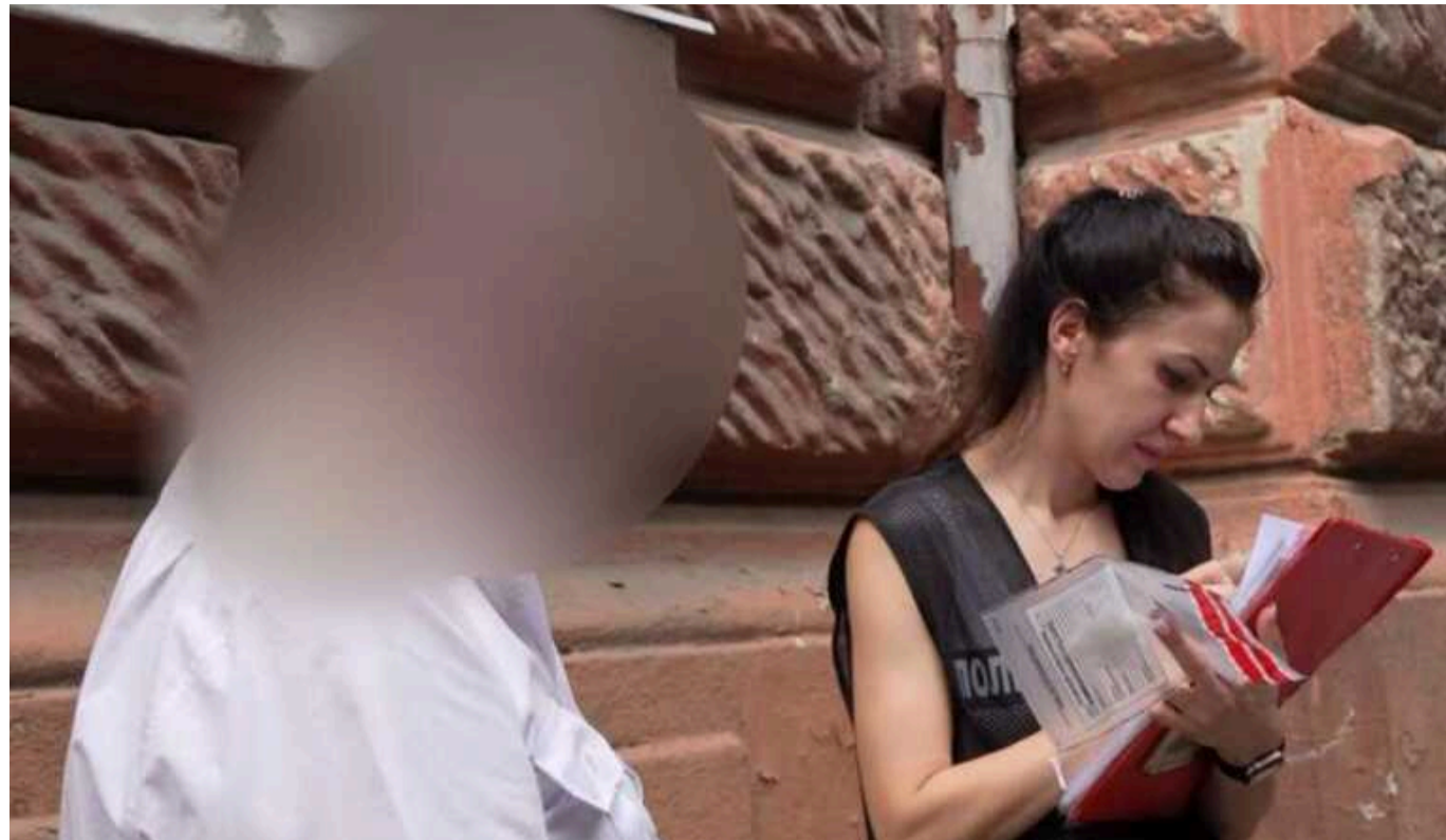
В Одесі за підозрою в хабарництві затримали керівників двох коледжів

Минулого тижня в Одесі було затримано двох керівників професійних навчальних закладів за підозрою в хабарництві.