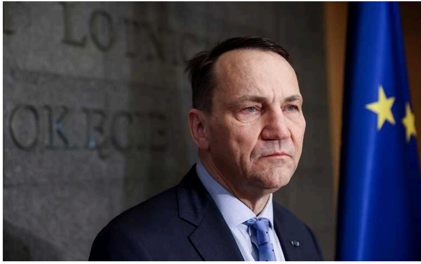
У Польщі не можуть сформувати бригаду з українських біженців, тому що не вистачає добровольців

Цю інформацію озвучив міністр закордонних справ Польщі Радослав Сікорський в інтерв'ю українським ЗМІ.