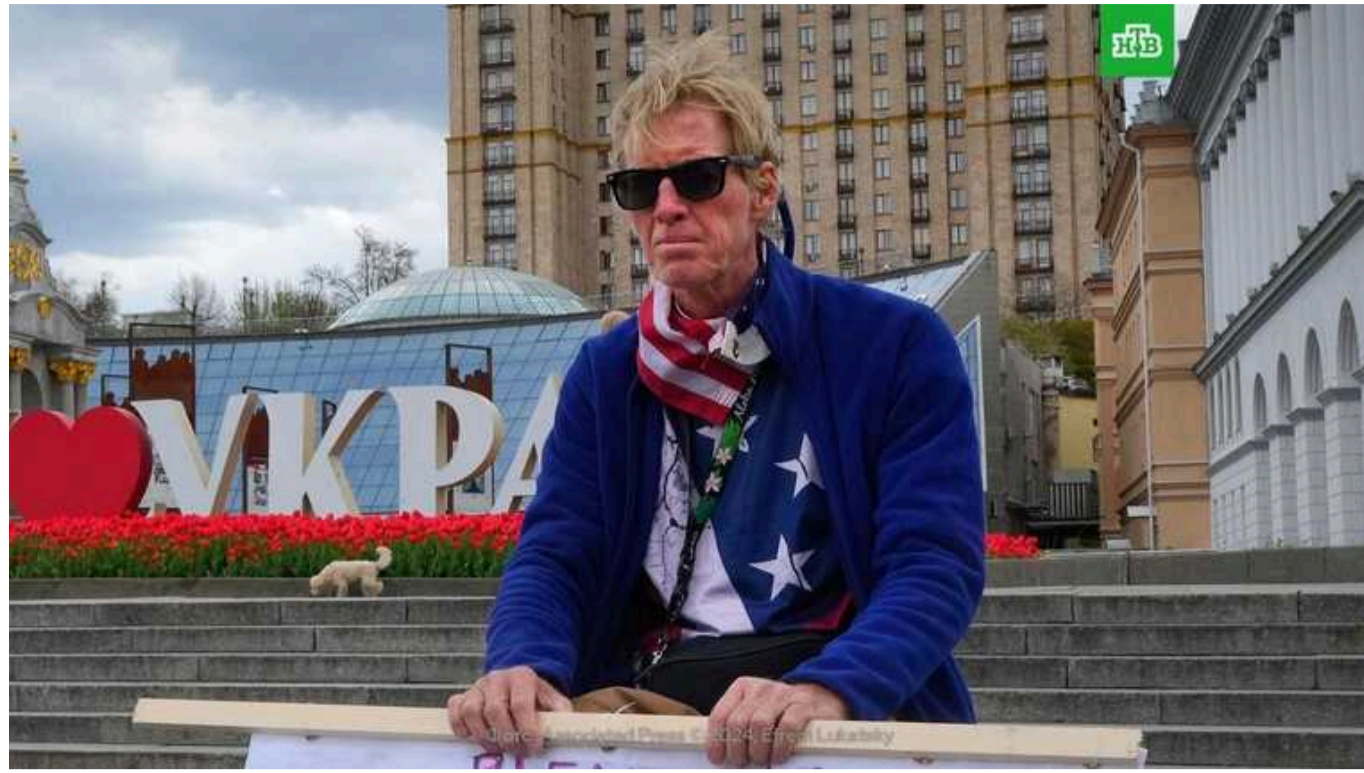
У ЗСУ підтвердили, що Рут, який скоїв замах на Трампа, зв'язувався з ними, пропонуючи рекрутів

Представник Іноземного легіону підтвердив CNN, що Рут зв'язувався з ними кілька разів.