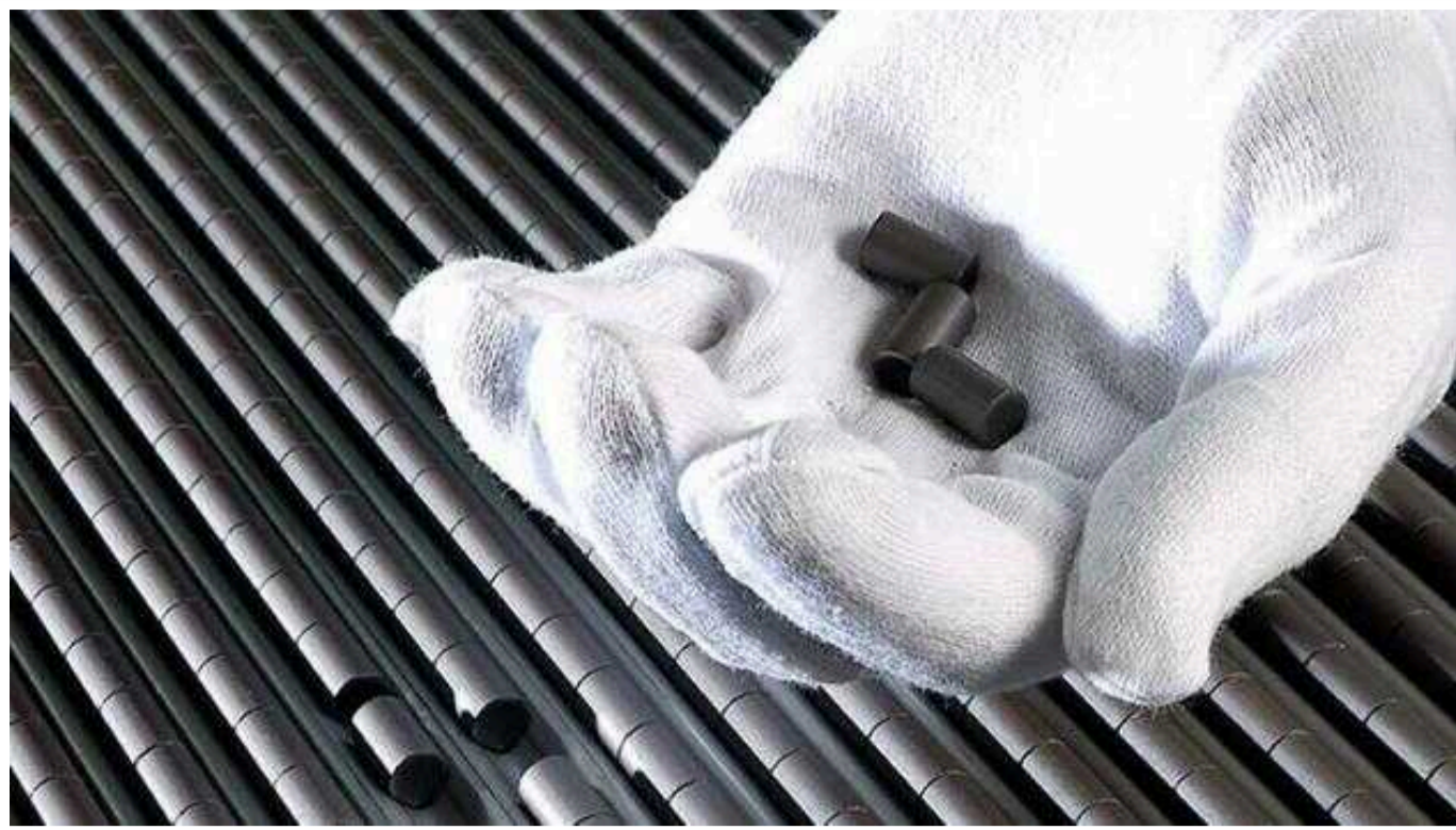
Україна почне виробляти власне ядерне паливо, – "Енергоатом"

Україна у 2026 році планує почати виробництво власного ядерного палива за технологією американської компанії Westinghouse. Передбачається, що його використовуватимуть лише на українських атомних електростанціях.