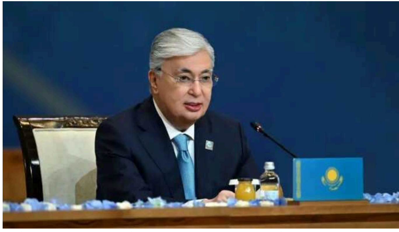
Президент Казахстану Токаєв висловив підтримку «мирному плану» Китаю та Бразилії щодо України

Президент Казахстану Касим-Жомарт Токаєв висловив необхідність спочатку прийняти рішення про зупинку бойових дій в Україні, а вже після цього обговорювати «територіальні питання», підтримуючи при цьому мирні ініціативи Китаю та Бразилії.