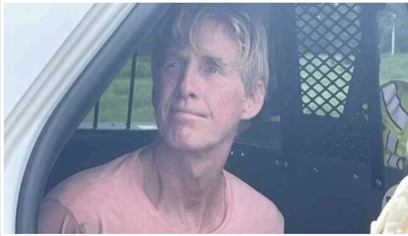
Підозрюваному в замаху на Трампа пред'явили обвинувачення

Чоловікові, який підозрюється у спробі замаху на життя експрезидента Дональда Трампа, у понеділок висунули обвинувачення за двома злочинами, пов'язаними з використанням зброї.