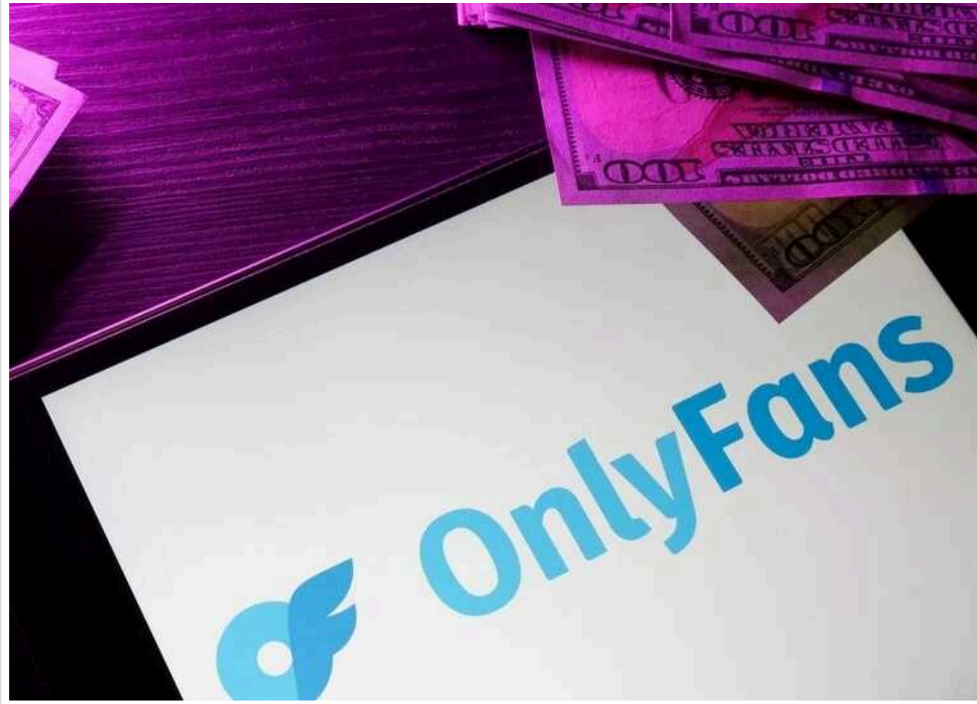
OnlyFans обігнала Apple, Microsoft Google та інших техногігантів за доходом на співробітника, — ЗМІ

Платформа OnlyFans зайняла перше місце серед великих технологічних компаній за обсягом виручки на одного співробітника .