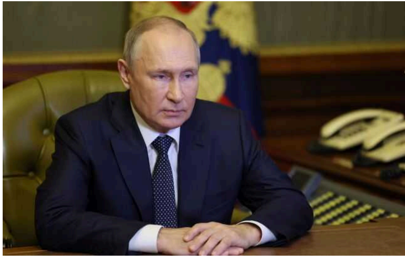
У РФ знову збільшили чисельність своєї армії: Путін підписав указ

Володимир Путін своїм указом розпорядився підвищити чисельність російської армії до 2 млн 389 тисяч осіб. Військовослужбовців стане 1,5 млн осіб.