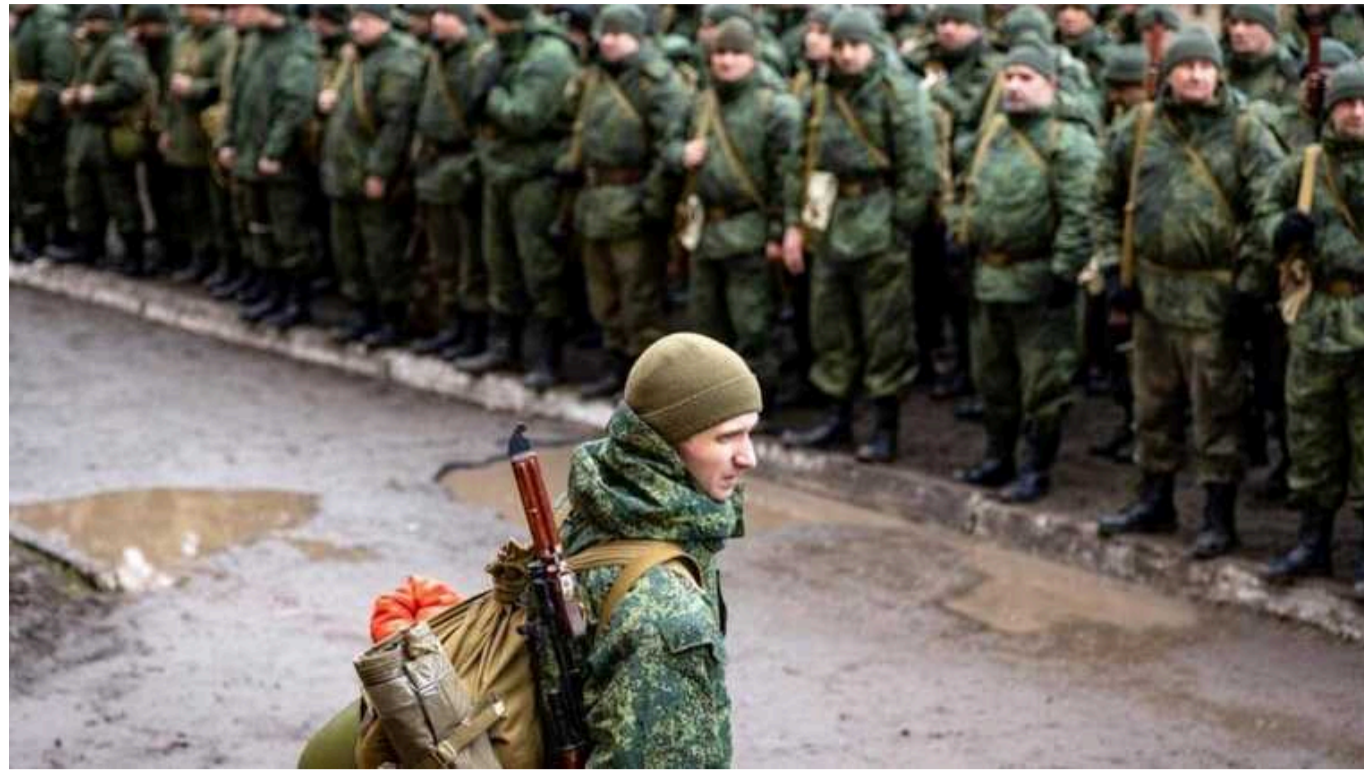
В окупованому Донецьку збирають списки чоловіків у центрі зайнятості й на ДМЗ

На одному з каналів, присвячених процесу мобілізації, з'явився лист, який було відправлено на пошту Донецького металургійного заводу.