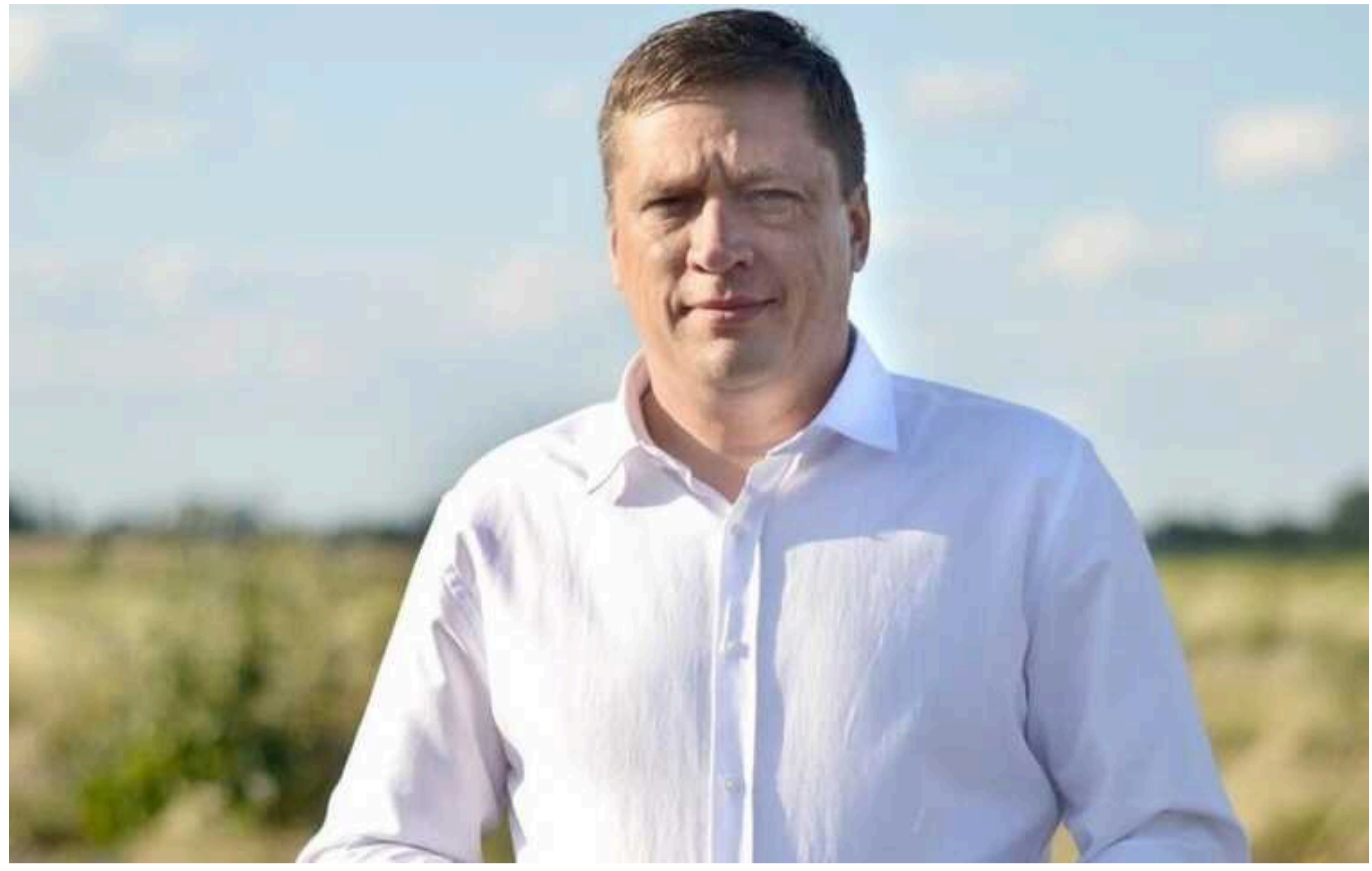
Депутат Іванісов через матір, яка проживає в окупованому Бердянську, придбав елітну нерухомість

Родина народного депутата Романа Іванісова за роки його перебування в парламенті придбала автомобілі та нерухомість майже на два мільйони доларів, хоча загальна сума готівкових заощаджень виявилася майже вдвічі меншою.