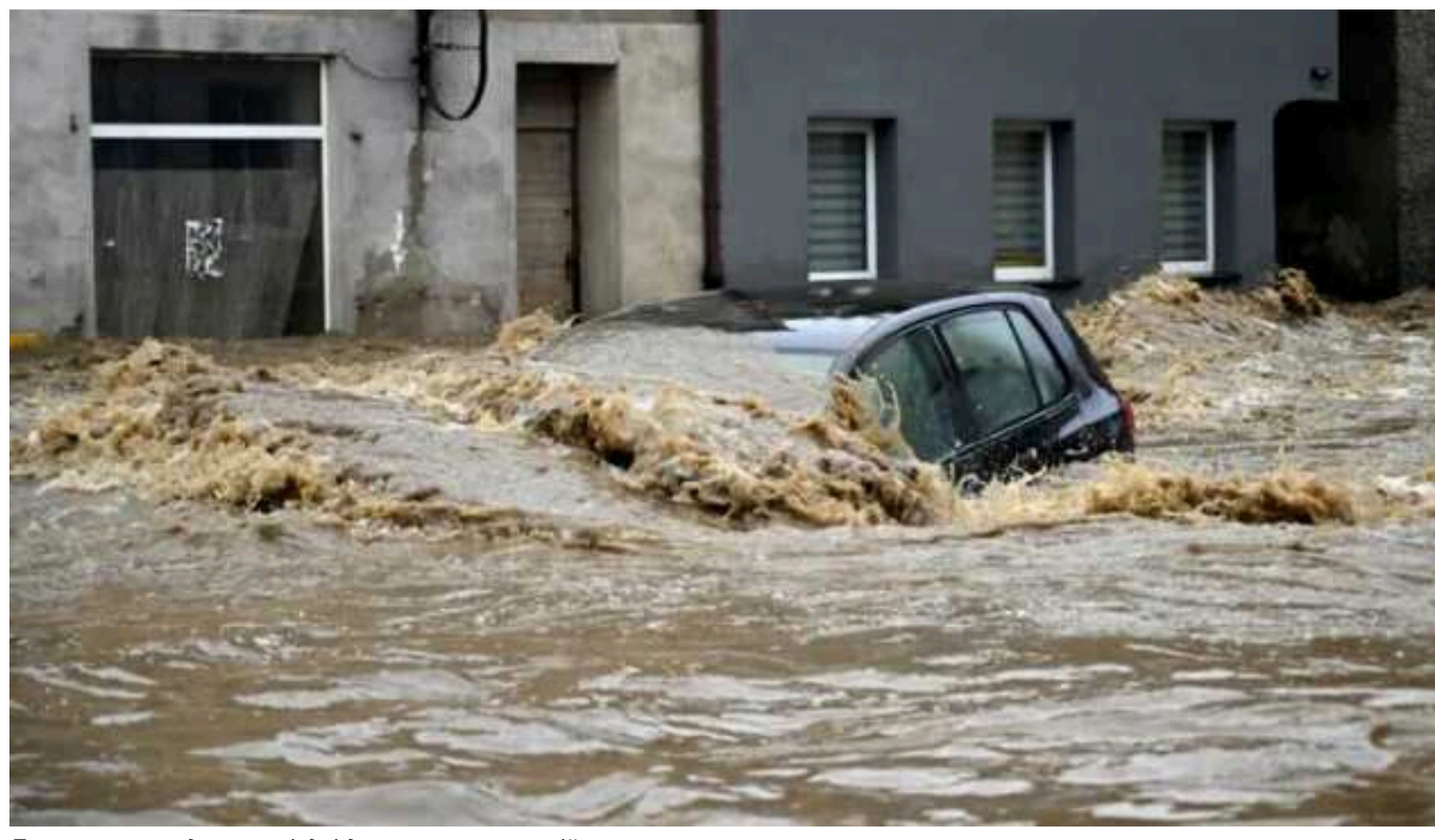
Польща запроваджує на півдні держави стан стихійного лиха

Уряд Польщі відсьогодні запровадив стан стихійного лиха у частинах Нижньосілезького, Опольського та Сілезького воєводств на півдні та південному заході країни.