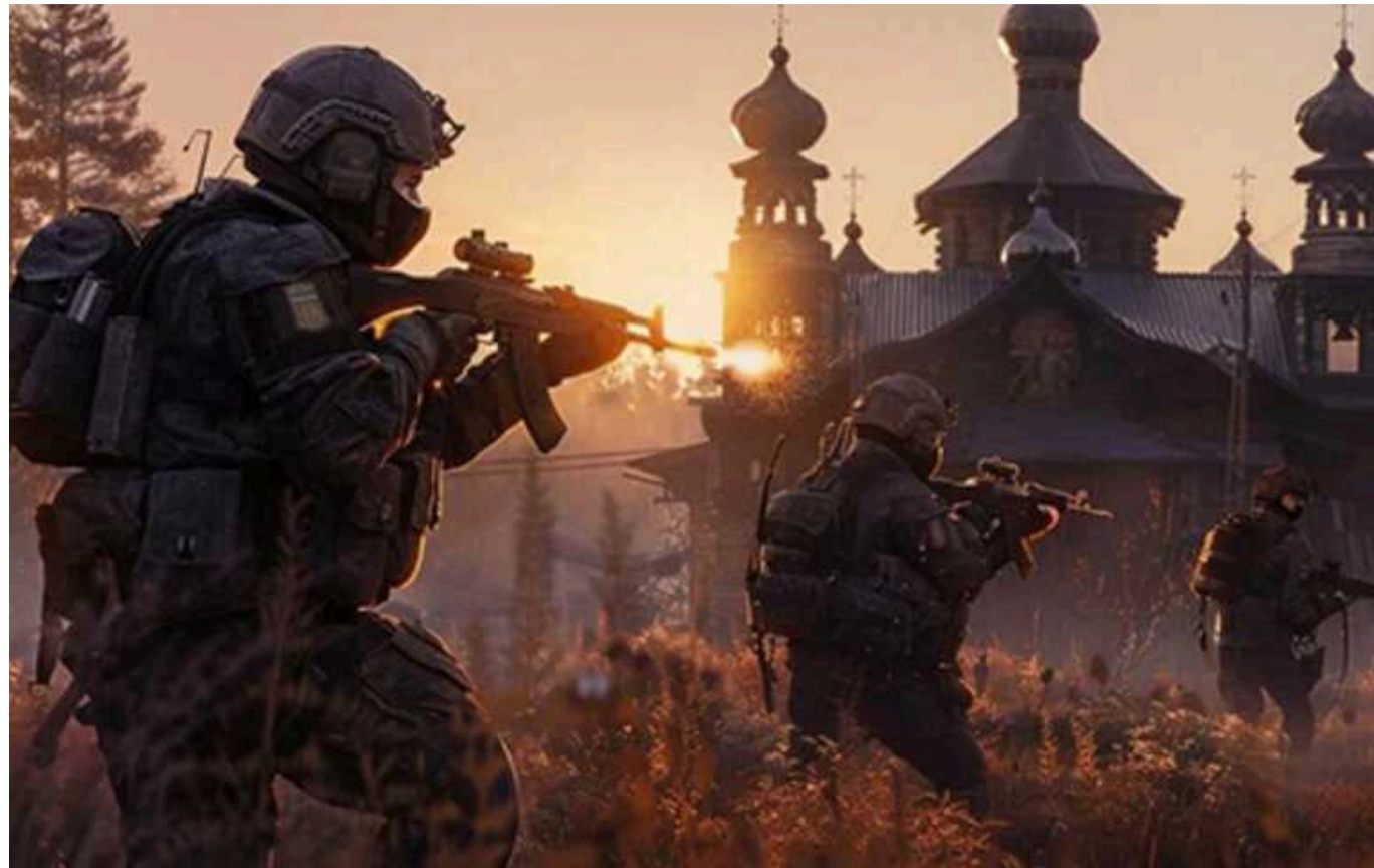
Росія на Курщині кидає в бій проти ЗСУ недосвідчених призовників, – Forbes

Те, що спочатку виглядало як невеликий і короткий штурм, швидко перетворилося на більш серйозну загрозу для росіян.