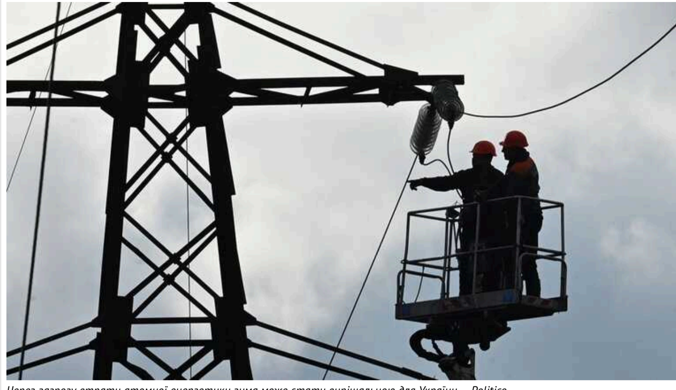
Через загрозу втрати атомної енергетики зима може стати вирішальною для України, – Politico

Майбутня зима може стати вирішальним моментом для України через загрозу втрати атомної енергетики, повідомляє американське видання Politico.