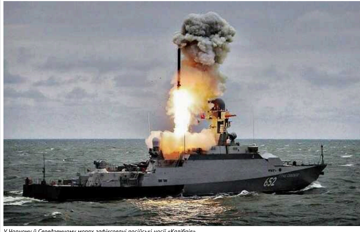
У Чорному й Середземному морях зафіксовані російські носії «Калібрів»

Станом на 06:00, 16 вересня, військові зафіксували в Чорному та Середземному морях ворожі ракетносії. Загалом виявлено шість кораблів.