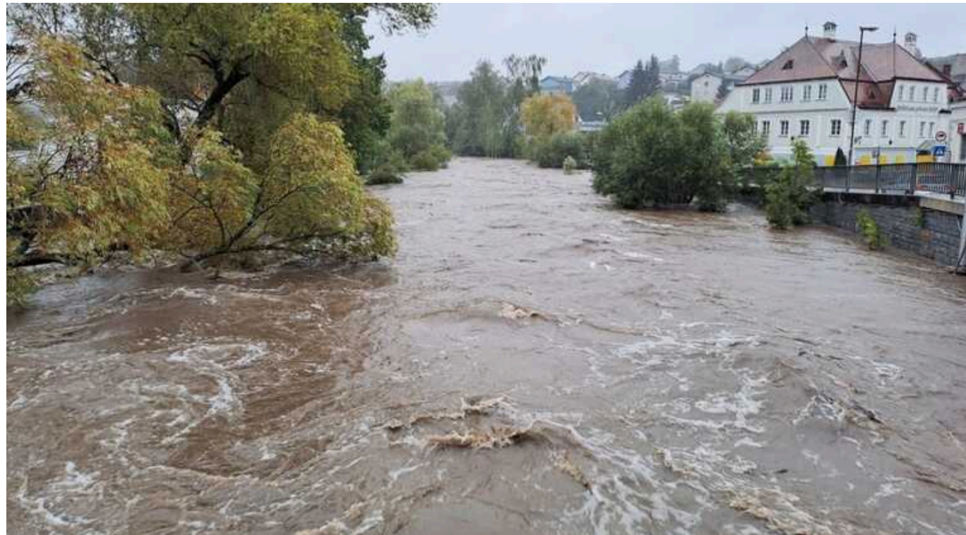
В Австрії через дощі зруйновано дві дамби: затопило деякі населені пункти

В Австрії потужні та тривалі дощі призвели до прориву двох дамб. Як наслідок, затоплено кілька населених пунктів.