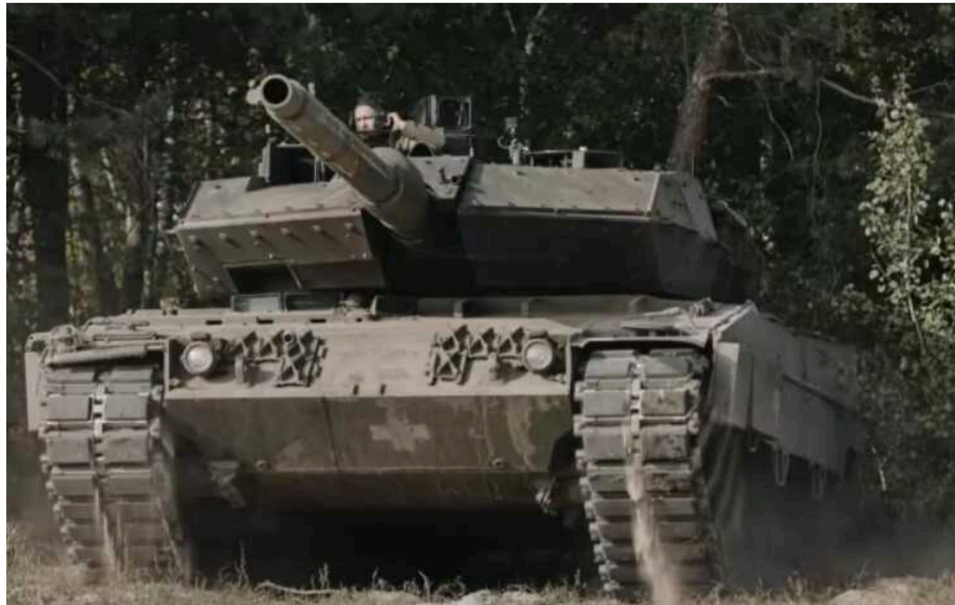
Ситуація на фронті: На Покровському та Курахівському напрямках найгарячіше

Від початку доби на фронті сталося 137 бойових зіткнень, найбільша кількість боїв пройшла на Покровському та Курахівському напрямках.