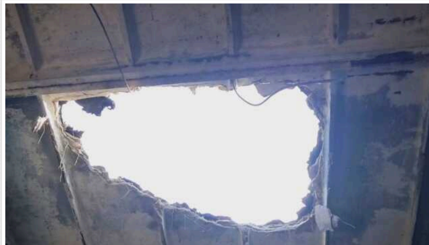
На Сумщині протягом дня зафіксовано 103 вибухи та 43 обстріли

Ворог продовжує обстрілювати Сумщину, сьогодні зафіксували 103 вибухи.