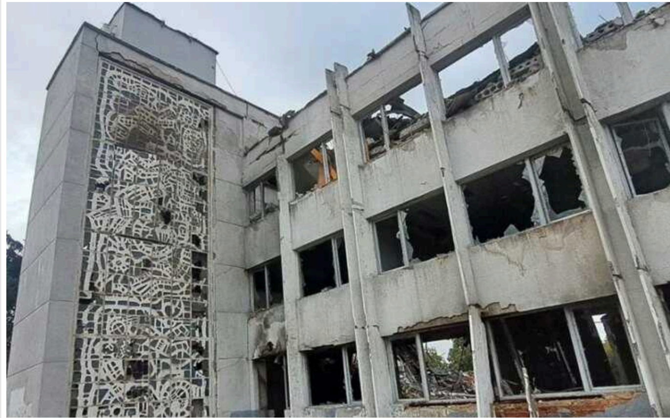
У Павлограді окупанти зруйнували будівлю палацу культури в модерністському стилі

Палац культури "Машинобудівників" у Павлограді на Дніпропетровщині знищений внаслідок обстрілів росіян.