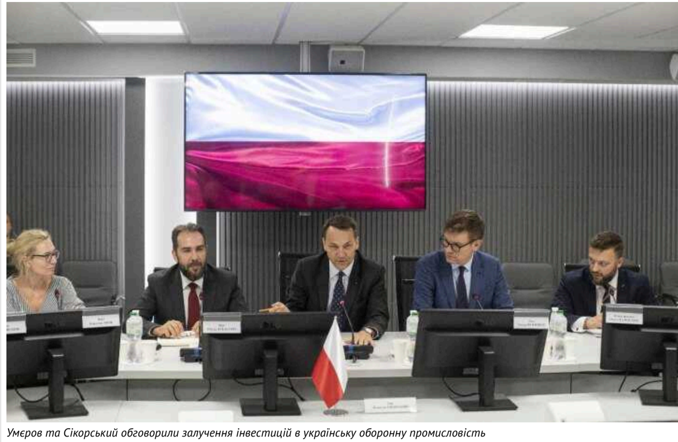
Умеров та Сікорський обговорили залучення інвестицій в українську оборонну промисловість

Міністр оборони Рустем Умеров провів зустріч із делегацією Польщі під керівництвом міністра закордонних справ Радослава Сікорського.