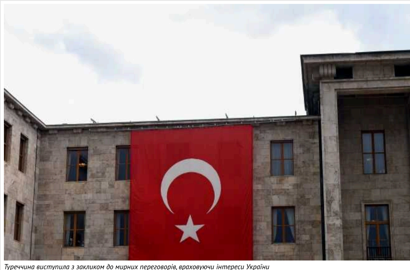
Туреччина виступила з закликом до мирних переговорів, враховуючи інтереси України

Туреччина прагне якомога швидшого завершення війни в Україні. Для цього вони пропонують скористатися мирними переговорами з урахуванням інтересів України.