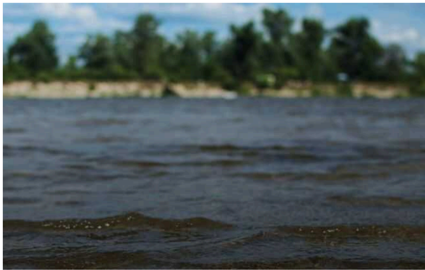
Забруднення річки Десна досягло Київської області

Забруднення річки Десна дісталось Київської області. Станом на 15 вересня, пляма забруднення вже спостерігається між селами Літки та Рожни.