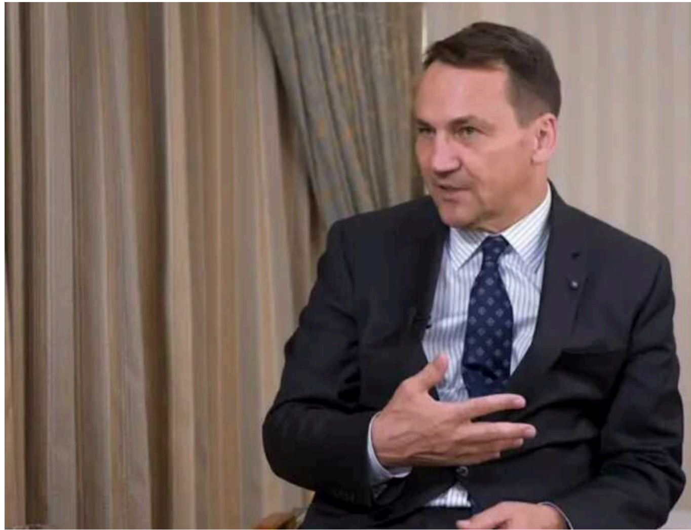
Сікорського обурює, що у Варшаві його стриже український перукар

Сікорський переконаний, що українські чоловіки повинні захищати батьківщину, а не жити за кордоном.