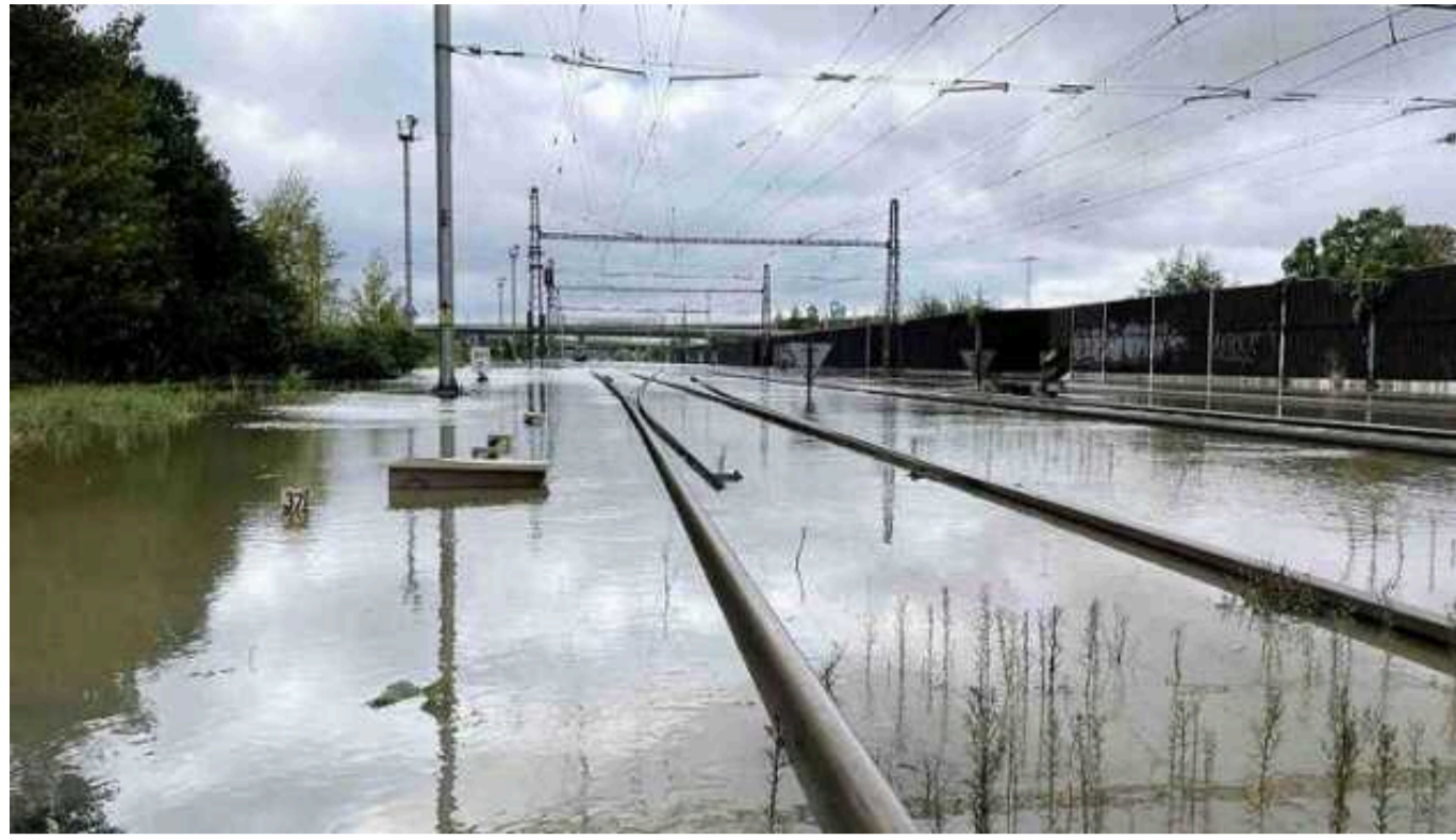
УЗ оновила інформацію про рух потягів на тлі повені у Чехії, Австрії та Польщі

Українізниця повідомила про зміни у розкладі міжнародних потягів через повені в Чехії, Австрії та Польщі.