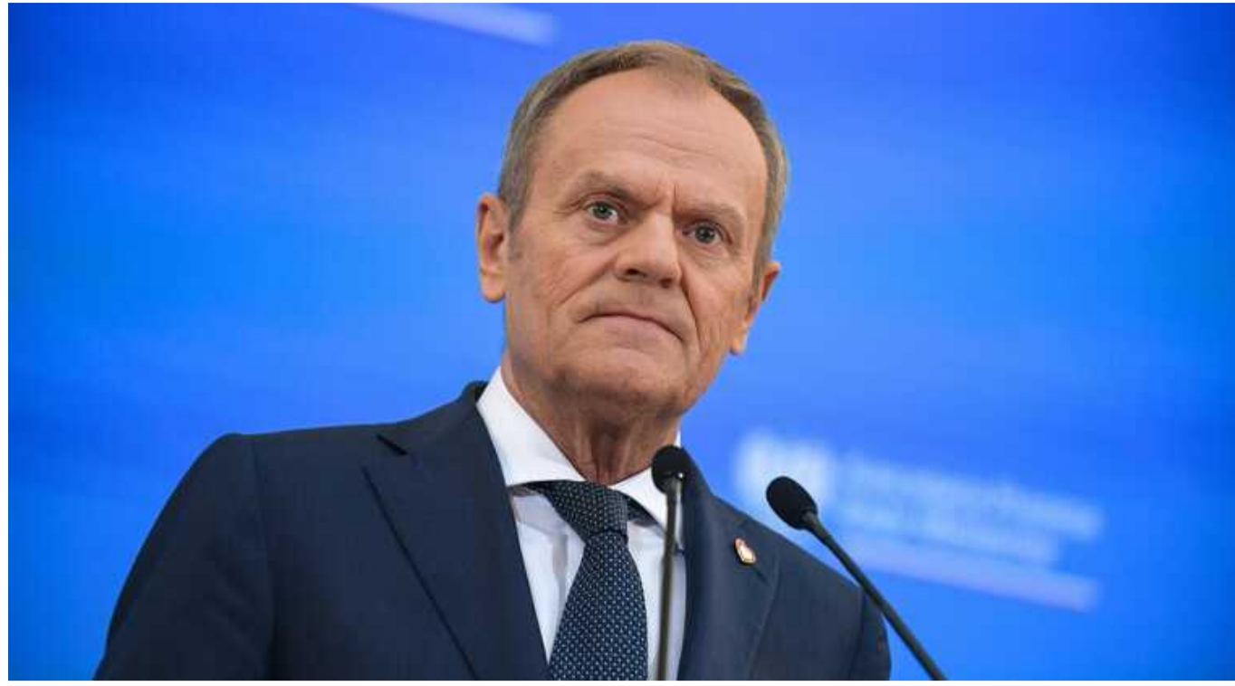
Туск розпорядився оголосити у Польщі НС через стихійне лихо

Прем'єр-міністр Польщі Дональд Туск повідомив, що має намір оголосити в країні стан стихійного лиха у зв'язку з масштабними повенями.