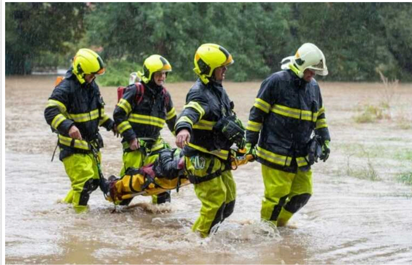
Україна запропонувала шести європейським країнам допомогу в подоланні наслідків повеней

Президент України Володимир Зеленський доручив міністру закордонних справ України Андрію Сибізі запропонувати країнам-сусідам допомогу українських рятувальників у ліквідації наслідків повені, викликаной екстремальними опадами.