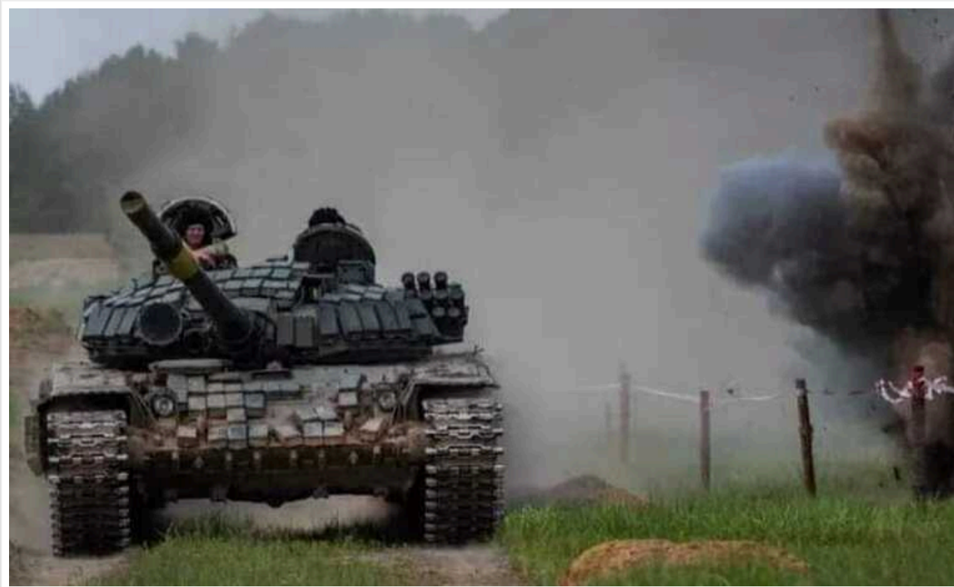
В елітних військах РФ на Курщині спостерігаються проблеми

Країна-агресорка Росія значно посилала свої війська для витіснення ЗСУ з Курської області, сформувавши угруповання в 40 тисяч осіб. Проте, враховуючи ірраціональність дій окупантів, їм потрібно 80-100 тисяч. Крім того, у ворога виникають труднощі з завданням ударів, оскільки він не може визначити, "де свої, а де чужі".