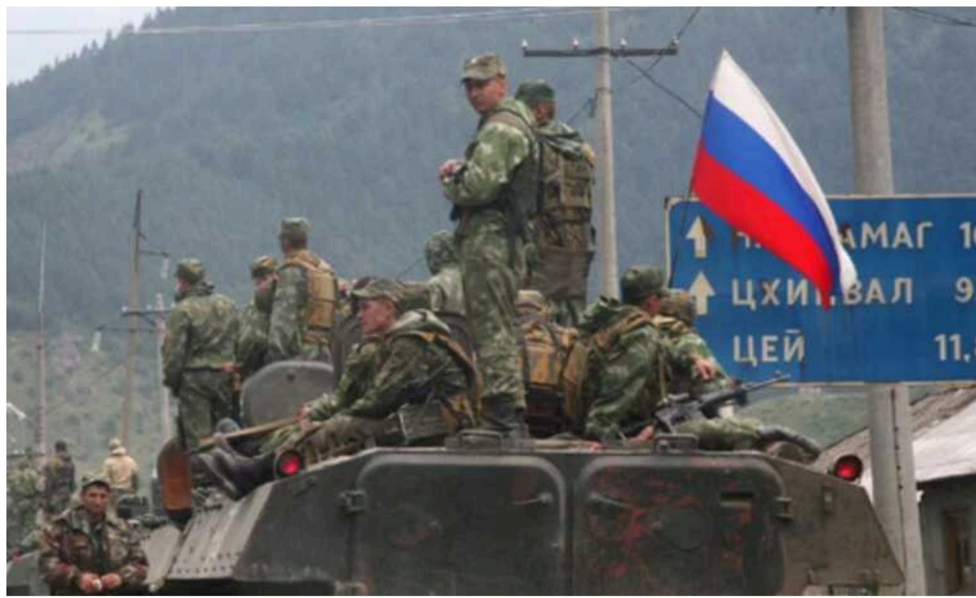
Грузія повинна покаятися за війну 2008 року, - Іванішвілі

Засновник керівної партії "Грузинська мрія" Бідзіна Іванішвілі заявив, що партія експрезидента Грузії Михайла Саакашвілі винна в російській агресії 2008 року.