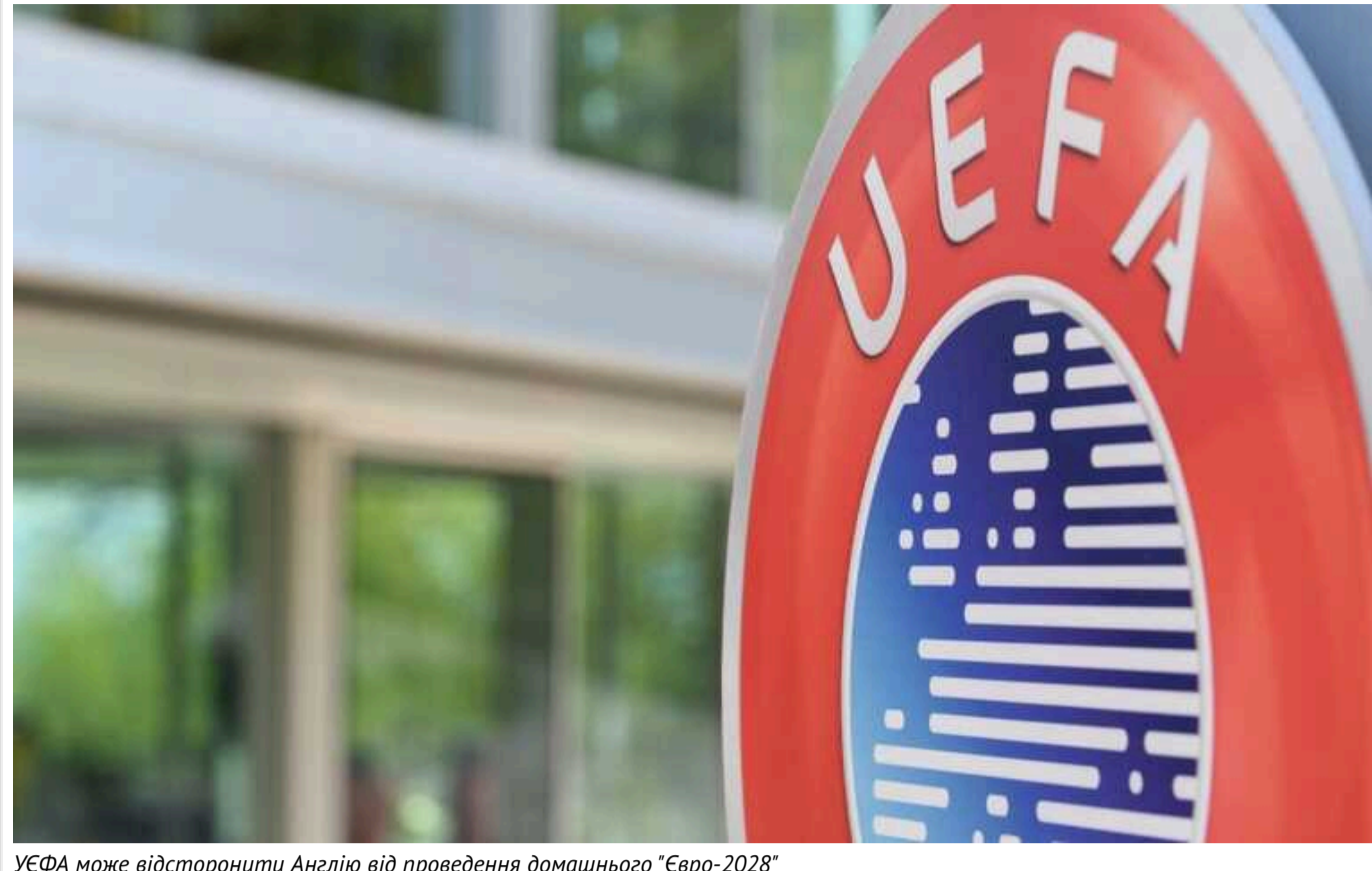
УЄФА може відсторонити Англію від проведення домашнього "Євро-2028"

Європейський союз футболних асоціацій (УЄФА) попередив уряд Великої Британії про те, що Англію може бути відсторонено від чемпіонату Європи, який вона спільно проводитиме з Північною Ірландією, Ірландією, Шотландією та Вельсом у 2028 році.