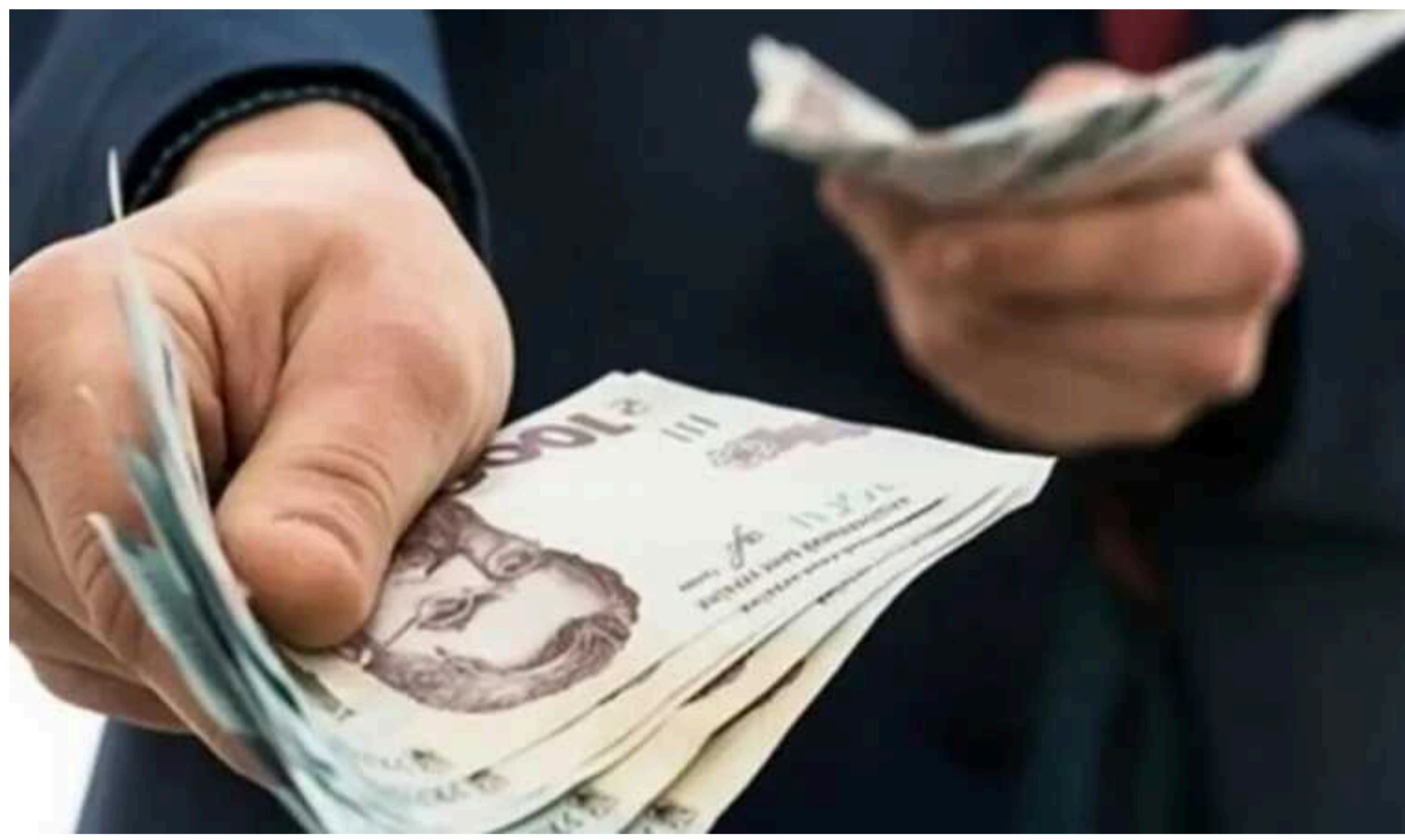
У ВР пояснили, кому з ВПО доведеться віддати виплати

Загальний дохід родини переселенців не повинен перевищувати 9 444 гривні. Якщо ліміт буде перевищено, соціальний захист визначить, з якого місяця доходи стали вищими, і виплати для ВПО доведеться повертати.