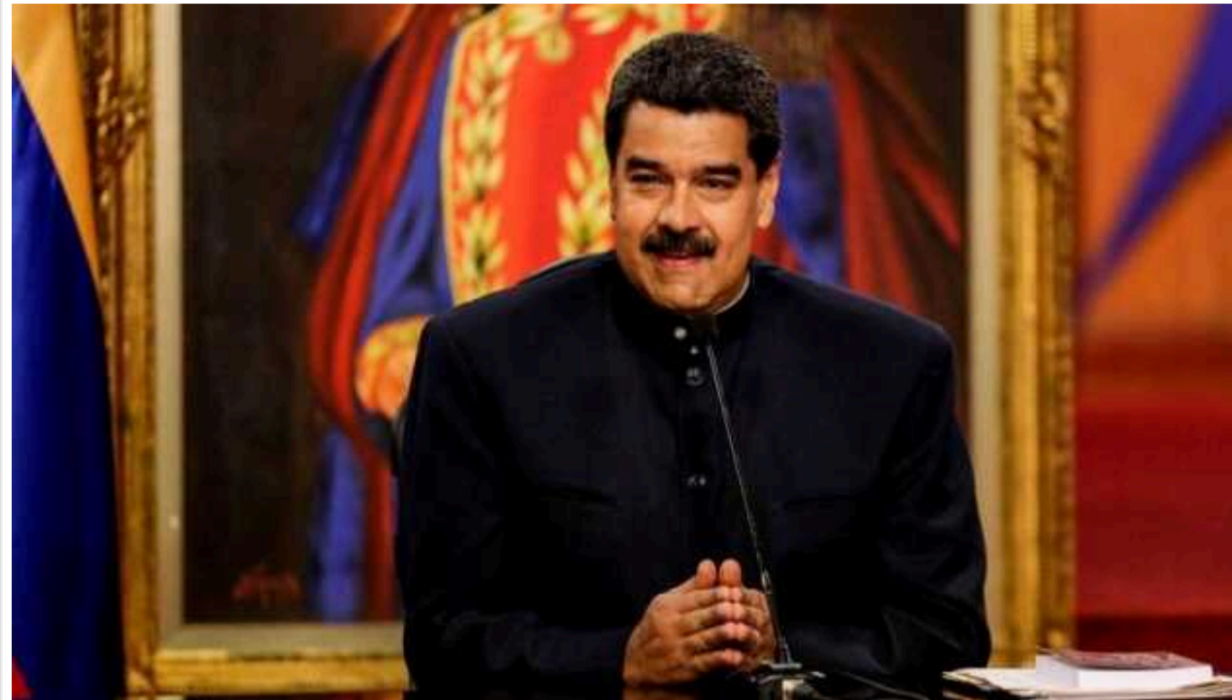
У Венесуелі затримали групу іноземців за підозрою в організації замаху на Мадуро

У Венесуелі затримано групу іноземців, яких підозрюють у змові з метою ліквідації президента Венесуели Ніколаса Мадуро.