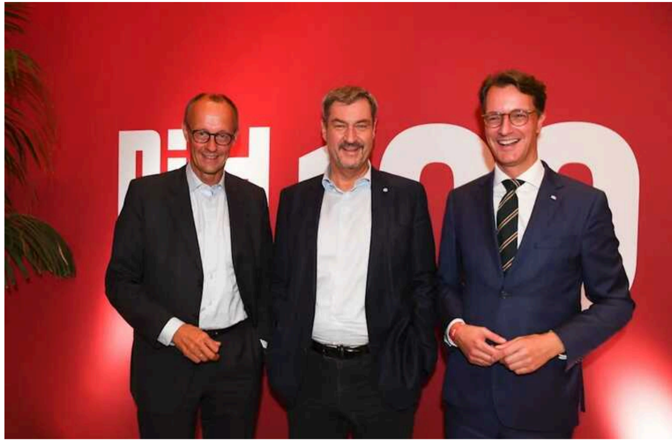
Головна опозиційна сила Німеччини отримала рекордний рівень підтримки за останні роки

Головна опозиційна сила Німеччини, консервативний союз ХДС/ХСС, демонструє швидке зростання популярності серед виборців.