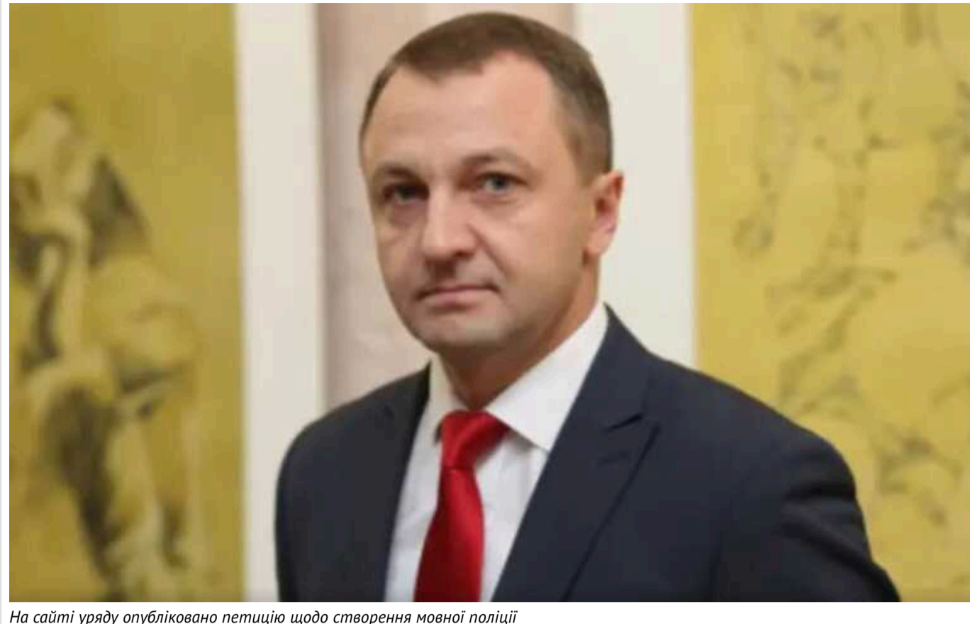
На сайті уряду опубліковано петицію щодо створення мовної поліції

На 15 вересня документ отримав 1 394 голоси з 25 тисяч необхідних.