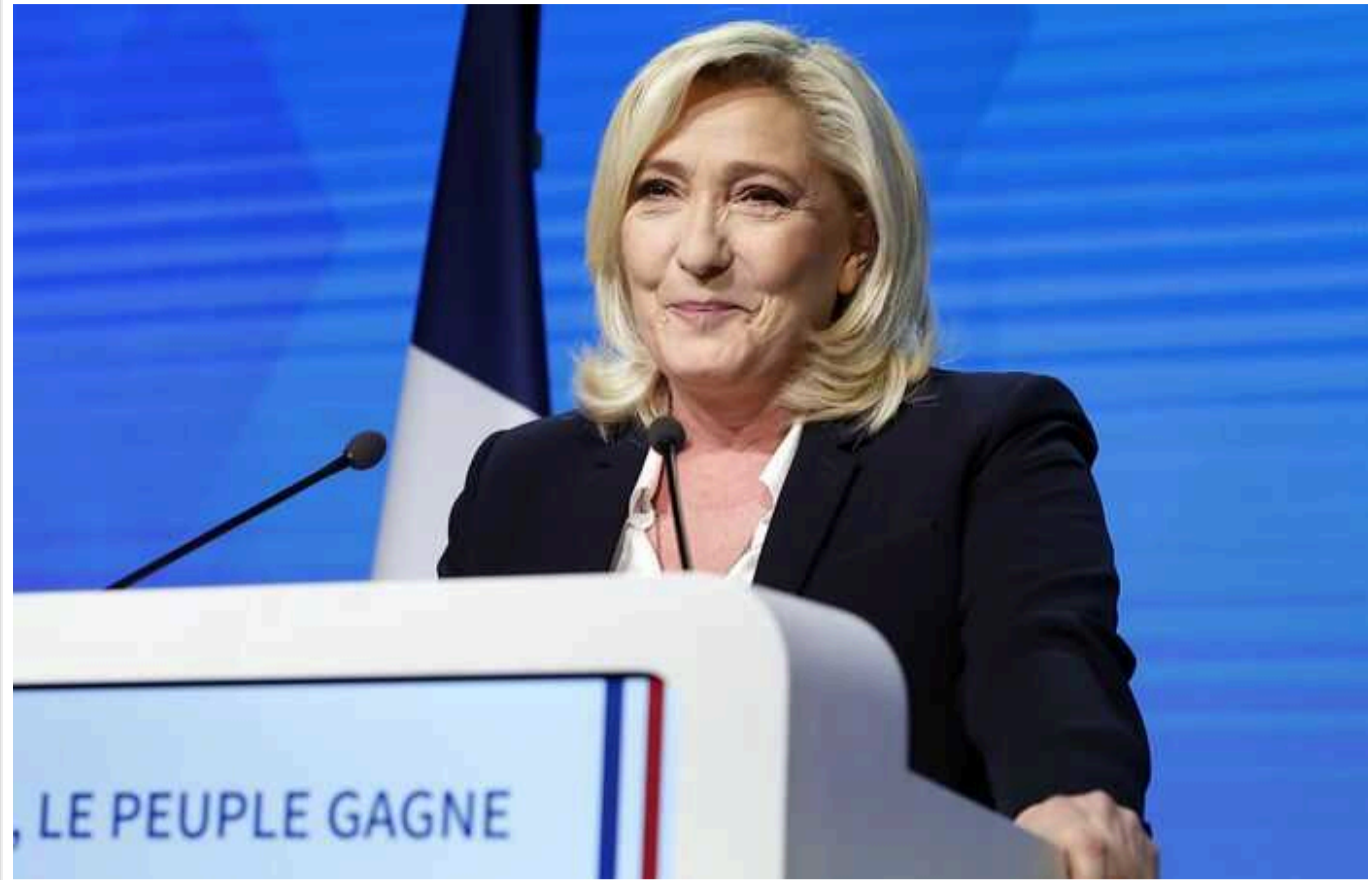
Ле Пен передбачає, що вже наступного року відбудуться нові дострокові вибори до парламенту Франції

Лідерка депутатів ультраправої партії Марін Ле Пен впевнена, що Національну асамблею Франції розпустять у 2025 році, тому закликає своїх прибічників вже почати передвиборчу кампанію до нового парламенту.