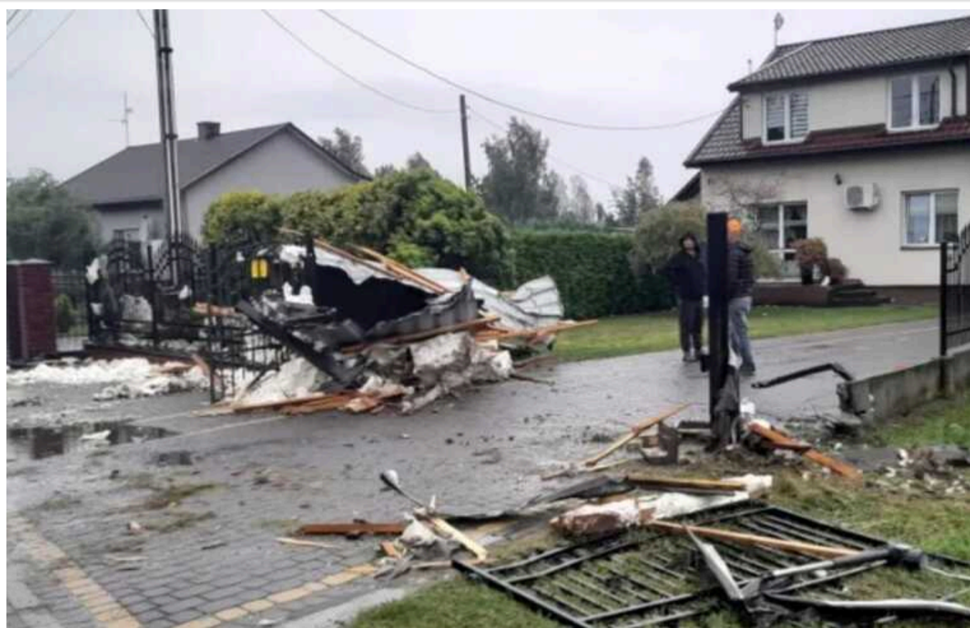
Неподалік Варшави пройшов торнадо: пошкоджено десятки будинків

У другій половині дня 14 вересня поблизу Варшави було зафіксовано гігантський торнадо, який спричинив руйнування в кількох населених пунктах. У селах Вержховина, Урбанове, Крушине та Божена-Воля були пошкоджені будівлі та транспортні засоби.