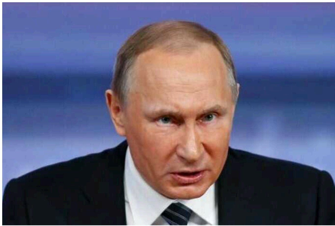
Путін наказав терміново створити літак «Байкал»

Новий проєкт ЛМС-901 "Байкал" повинен замінити легкий транспортний літак "Ан-2". Дати його випуску постійно відсувають, а ціна виробу за час зупинки виробництва зросла майже в чотири рази.