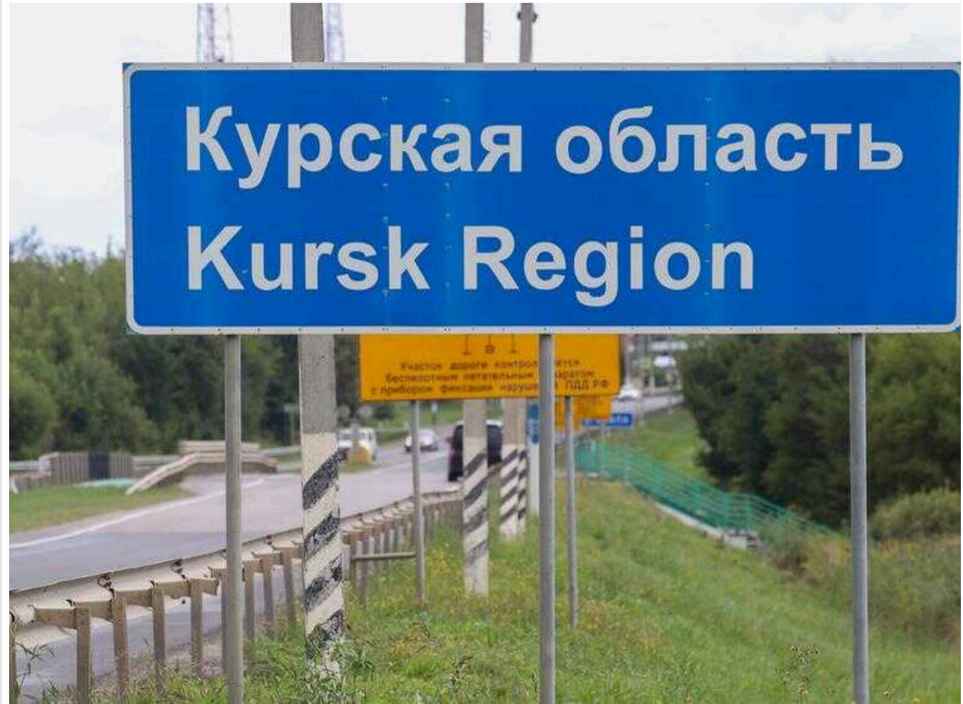
ЦНС: На Курщині цивільні допомагають Силам оборони ліквідувати техніку та склади РФ

Провал російського командування в Курській області та сумнівні досягнення на Донбасі підштовхують росіян до співпраці з Силами оборони України.