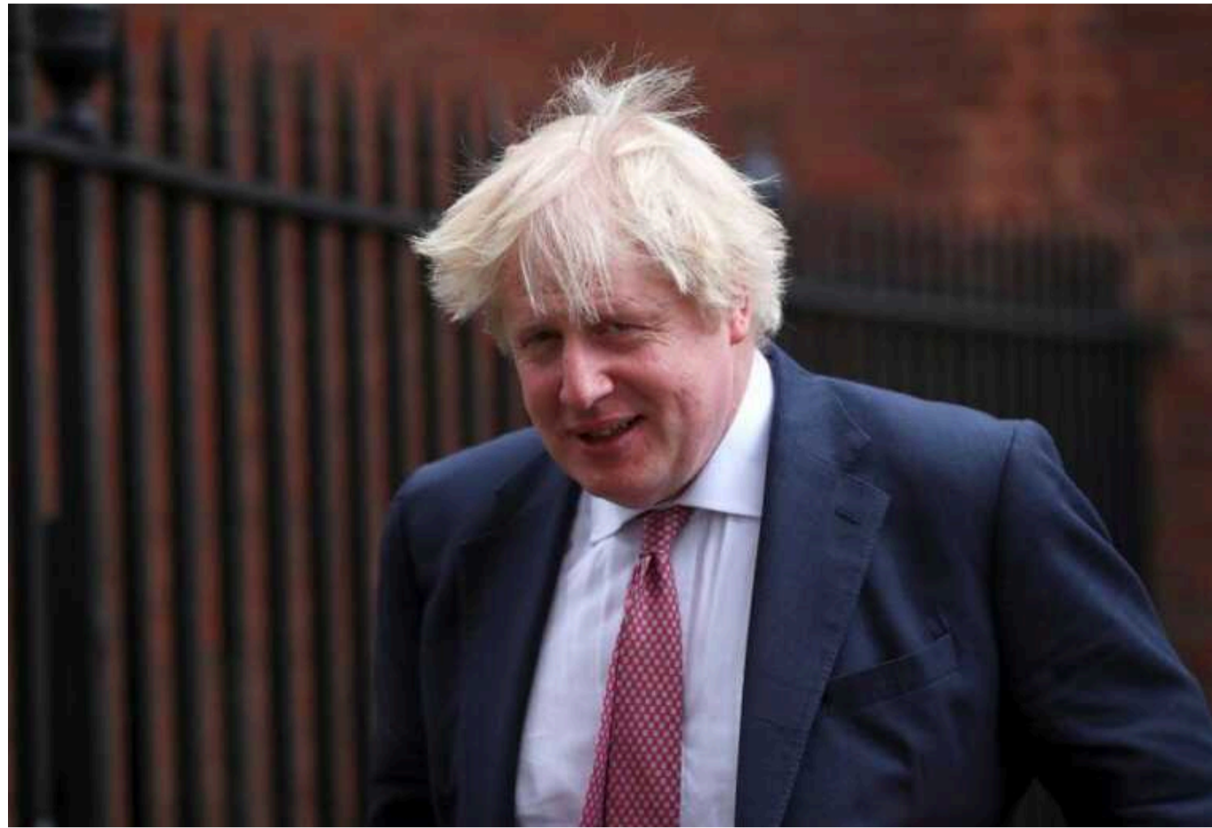
Борис Джонсон та ексміністри оборони закликали Стармера дозволити Україні ракетні удари по РФ

Колишній прем'єр-міністр Великої Британії Борис Джонсон та п'ятеро колишніх міністрів оборони закликали чинного главу уряду Кіра Стармера дозволити Україні використовувати крилаті ракети Storm Shadow для ударів по території Росії. Колишні урядовці підкреслили, що Британії не слід чекати на схвалення від США.